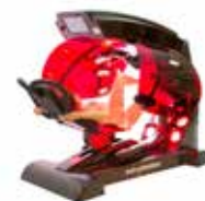
Dopo 2 anni di ricerca nasce InfraBaldan: la soluzione definitiva per il dimagrimento