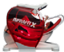
Presentazione di Infrafit X evoluzione di Infrafit