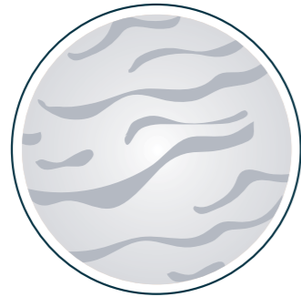
SMAGLIATURE DI TUTTI I TIPI

Il metodo per correggere e nascondere in modo semi permanente e in una sola seduta, tutti quegli inestetismi fino ad oggi ritenuti intrattabili: